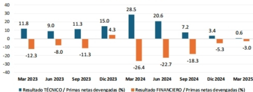
Indicadores trimestrales de resultados - Total del mercado de Seguros Marzo 2023 - Marzo 2025

El siguiente cuadro presenta la composición del Activo, Pasivo, PN y resultados según ramas; y también los indicadores Financiero y de Cobertura, todo ello a la última fecha presentada por la SSN, al 31 de marzo de 2025. Los indicadores de cobertura se mantienen superiores a 100, lo cual es favorable para la solvencia del sector (para los ramos de Vida y Retiro no se presentan los indicadores financieros debido a la naturaleza del cálculo; las deudas con asegurados representan bajos valores).